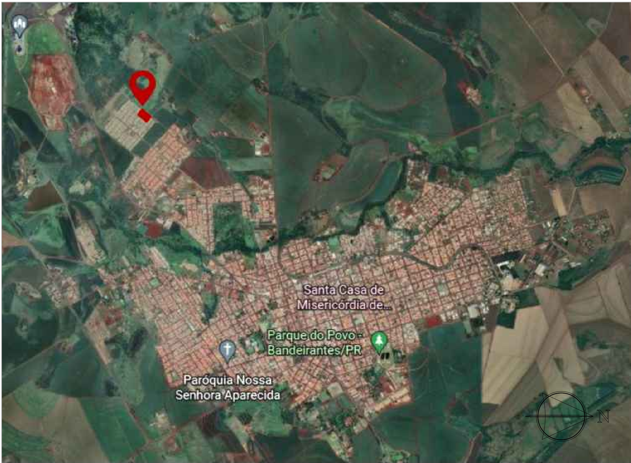
VISTA AÉREA DA CIDADE DE BANDEIRANTES sem escala